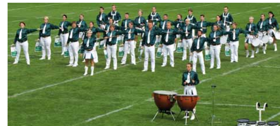
Der Fanfarenzug bei der Fanfaronade 2013.

Dresden, so werden sie offiziell genannt, waren in der vergangenen Wettkampfsaison überaus erfolgreich. Zwei deutsche Vizemeistertitel zu den 3. offenen Deutschen Meisterschaften in Chemnitz und der zweite Platz in der Gesamtwertung der FANFARONADE in Potsdam waren der Lohn langjähriger Arbeit. Den Sächsischen Landesmeistertitel haben die Dresdner seit